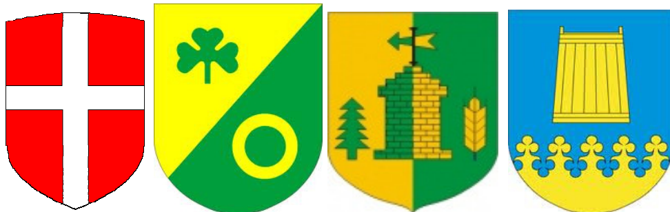
Tallinna väike vapp, Võru valla vapp, Koigi valla vapp, Kernu valla vapp